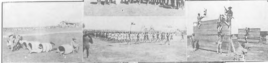
El 10 de Octubre en la Habana.—Diversos aspectos de la fiesta militar celebrada en la Cabaña.

El Ejército rindió tributo á la fecha, celebrando animadas fiestas, los veteranos lo mismo, el Ayuntamiento también intentó hacer al-