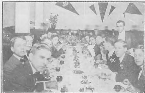
Banquete en el hotel "Sevilla" con el Atlético, para celebrar el campeonato de baseball de verano.

De una fiesta simpática que tuvo lugar en Mariano, en la sociedad de este nombre, daríamos extensos detalles a disponer de mayor espacio. A falta de este, publicamos una nota gráfica en la que se ve el aspecto que ofrecía el salón-teatro "Lena Park", en donde tuvo lugar la velada en la que tomaron parte notables señoritas y caballeros aficionados al "bel canto" y a la música. La concurrencia salió