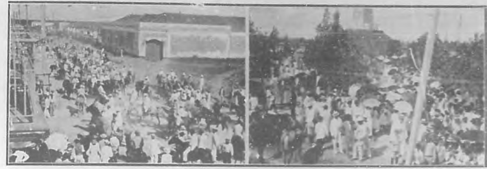
El 10 de Octubre en Cárdenas.—El general Machado y sus acompañantes dirigiéndose al monumento de los mártires de la Independencia.—Niños y niñas colocando flores con destino al monumento.

Juegos atléticos y ejercicios militares pusieron de mani-