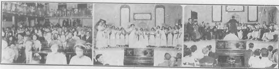
Interesante velada en "Lena Park", Mariano.—Varios aspectos de la misma.

Como nota final de la extensa información que hemos dedicado a los marinos chinos y a la colonia china con mo-