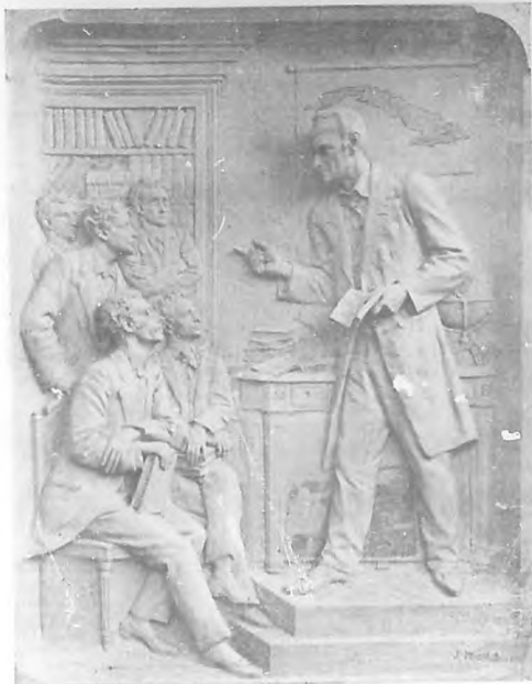
Monumento á Luz Caballero.—Un bajo relieve.

Por que, la verdad, únicamente siendo miope se puede decir ante los bajos relieves, que éstos sean "de recibo": ni el dibujo, ni la expresión, ni nada, absolutamente corresponde á la importancia de la obra.