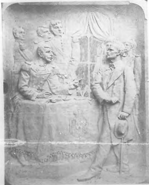
Monumento á Luz Caballero.—Otro bajo relieve

Así es que hasta pasada la primera quincena de noviembre no podemos decir en qué consistirá la velada que se organice ni la importancia que se dé á la misma.