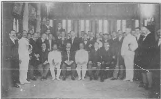
Un aspecto del "bañ" ofrecido por el Ayuntamiento á los marinos del "Hai-Chi" en los salones del Centro de Dependientes.